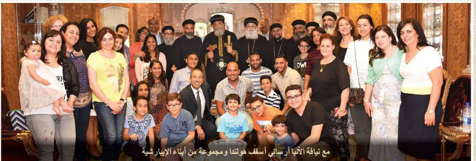
مع نيافة الأنبا أرساني أسقف هولندا ومجموعة من أبناء الإيبارشية