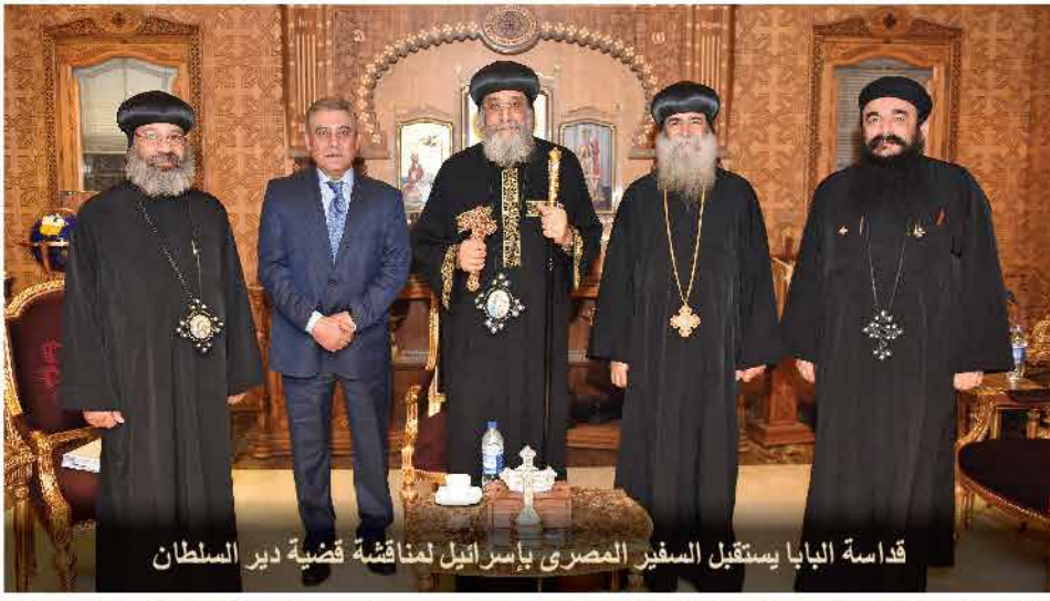
قداسة البابا يستقبل السفير المصري بإسرائيل لمناقشة قضية دير السلطان