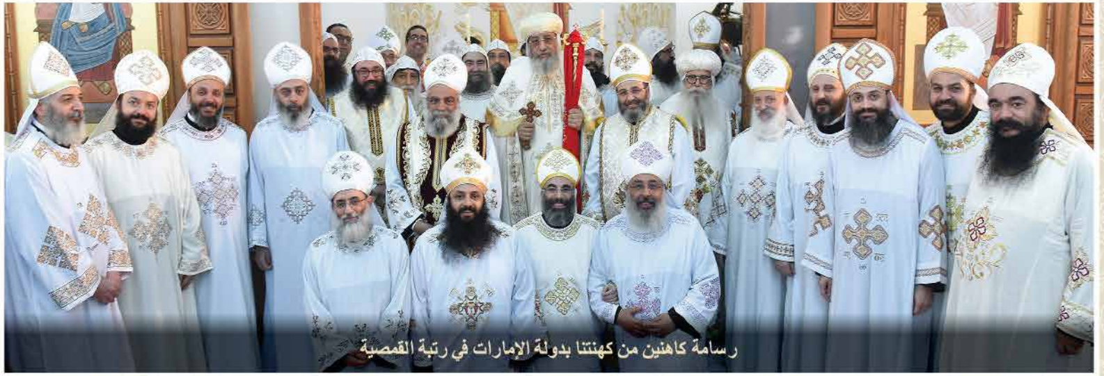
رسامة كاهنين من كهنتنا بدولة الإمارات في رتبة القمصية