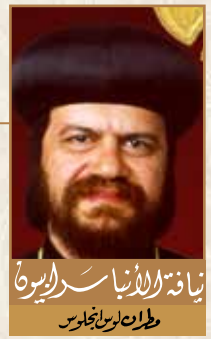
زيارة الأنبا سيرابون طران لوس نجوس