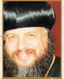
زيارة البابا فرنسيس أسقف عمان لشباب

والآن من السهل أن نضع النصين السابقين بجانب بعضهما البعض لنندرك أن ظهور الملاك ليوسف في الحلم ليطمئنه من جهة العذراء لم يكن كافياً ليستوعب مقدار كرامتها، بل أن ميلاد المسيح منها وما صحبه من عجائب كان هو وحده الحدث الجوهرى الذي أضاء بصيرة يوسف الروحية فانفتحت على غنى كرامة ومجد العذراء. بالتالي، كل من يحاول تكريم العذراء لشخصها وفضائلها بمنأى عن ربط كرامتها بميلاد المسيح منها فإنه لابد وأن يقع فيما وقع فيه يوسف من شك وحيرة.