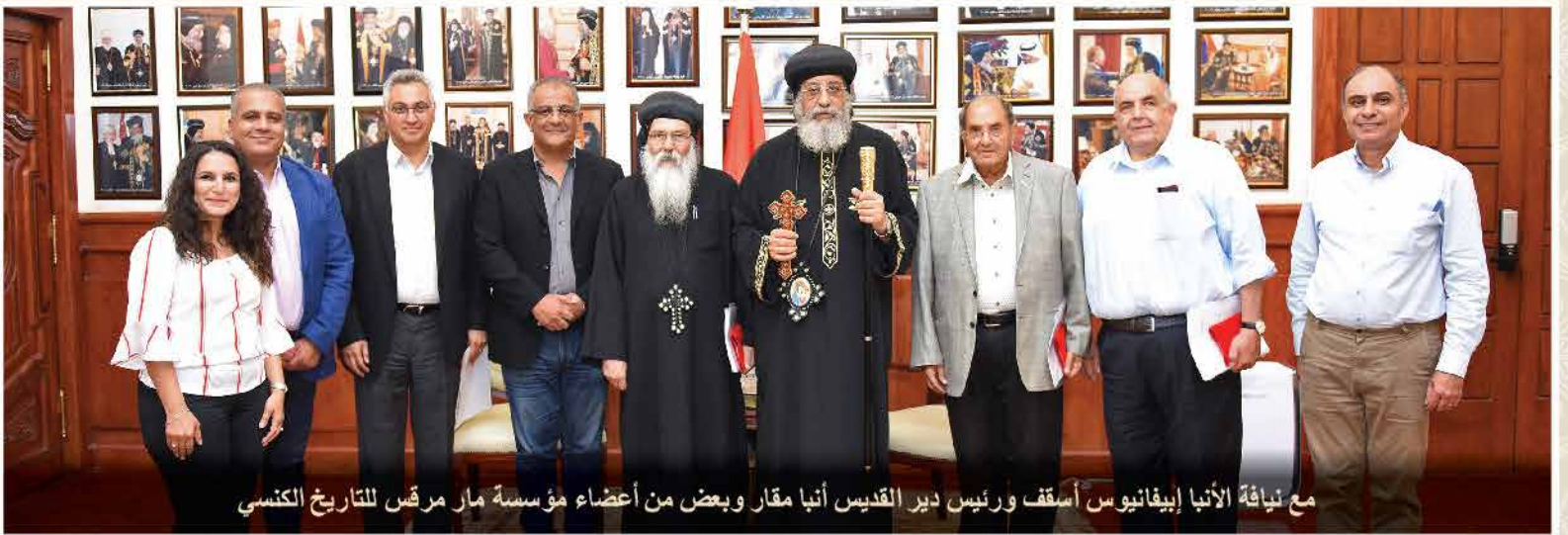
مع نيافة الأنبا إبيفانيوس أسقف ورئيس دير القديس أنبا مقار وبعض من أعضاء مؤسسة مار مرقس للتاريخ الكنسي