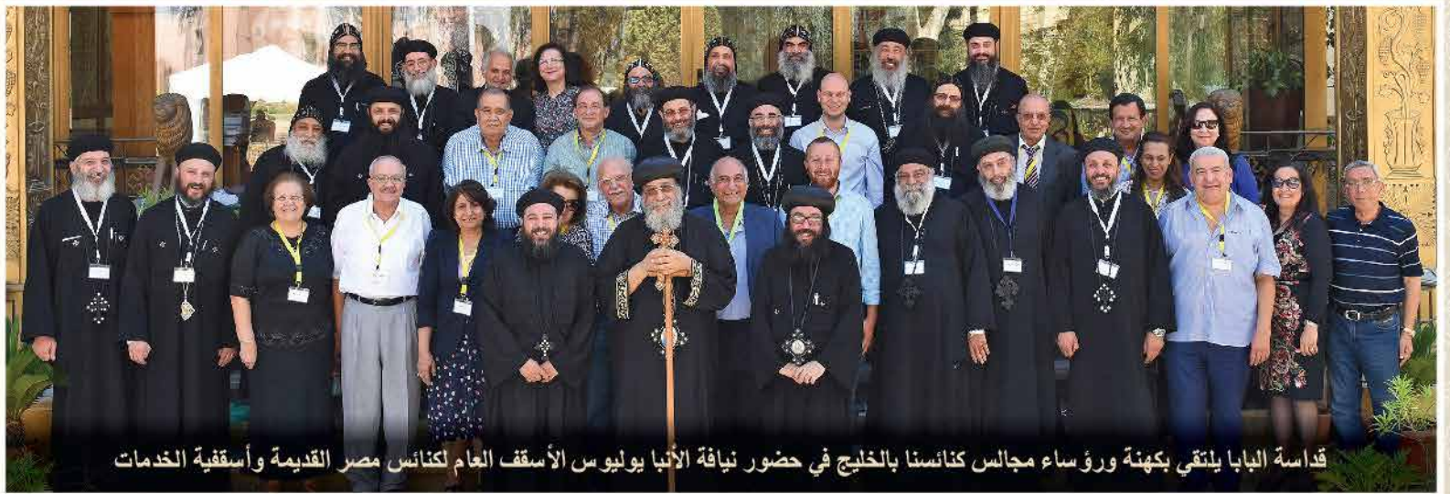
قداسة البابا يلتقي بكهنة ورؤساء مجالس كنائسنا بالخليج في حضور نيافة الأنبا يوليوس الأسقف العام لكنائس مصر القديمة وأسقفية الخدمات