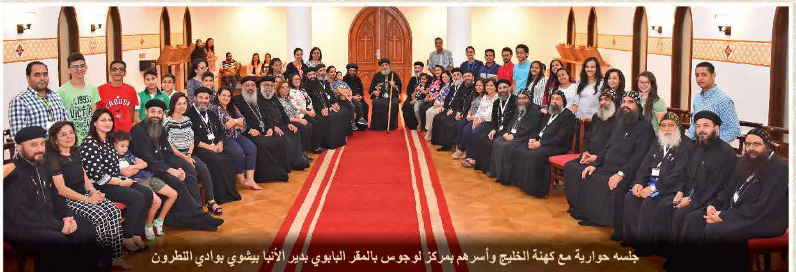
جلسة حوارية مع كهنة الخليج وأسرةهم بمركز لوجوس بالمقر البابوي بدير الأنبا بيشوي بوادي التنطرون