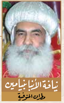
زيارة الأنبا يامين طران المنوفية

مع صوم العذراء يليق بنا أن نتأمل في مكانه العذراء في الإيمان الأرثوذكسي المستقيم، إذ اختارها الله دون بنات العالم لتكون والدة الإله، والوسيلة الرئيسية لإتمام التجسد الإلهي، لكي يُتمم خلاص البشرية بالصليب والقيامة والصعود وحلول الروح القدس، لنعيش هذا الخلاص..