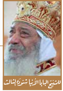
الشيخ البابا الأنبا شنودة الثالث

لذلك، فإن داود النبي - من جهة وعود الله - يقول للرب في المزمور «أذكر لعبيدك القول الذي جعلتني أنتظره، هذه هي تغزيتي في مذلتي، لأن قولك أحياني» (مز ١١٩: ٤٩، ٥٠).