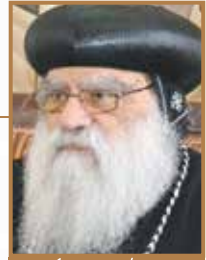
بازاء (الربنا باخوموس) مطران بجميرة وطران ورسال اذيقيا

+ الله في الضيقات يعطي لنا مثالا، فهو لا يظهر من خلال الزلزلة ولا الريح الشديدة ولا النار، لكن من خلال الصوت المنخفض الخفيف. فالخادم الروحي لا يحل مشاكل كنيسته بعنف ولكن بهدوء (الصوت المنخفض الخفيف)، والانسان الروحي لا يحل مشاكل بيته بالعنف ولكن بالوجود الهادي للرب وسط البيت.