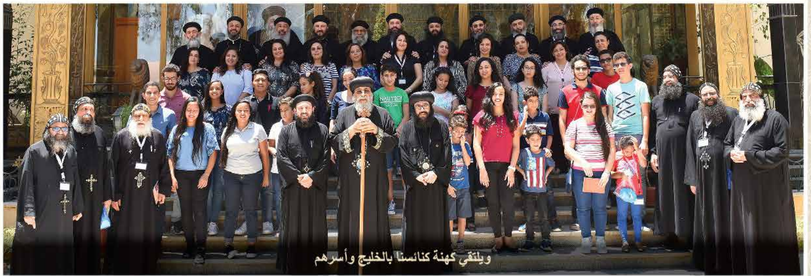
ويلتقي كهنة كنائسنا بالخليج وأسرةهم