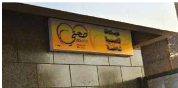
إعداد الأستاذة / بربارة سليمان

في عام ٢٠١٦ تم وضع اتفاقية تعاون بين المكتب البابوي للمشروعات ومؤسسة سان مارك القبطية للرعاية بالمملكة المتحدة، وذلك لتطوير وتوفير أعلى مستويات من الخدمات الطبية.