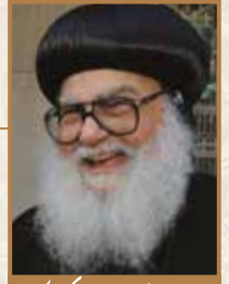
زيارة البابا فرنسيس أسقف عمان لشباب