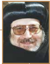
بازاء (الربنا بيشوى) مطران كمنشيتنج ورياطلهررك

الملاك المبشر بقولها «هُوَذَا أَنَا أَمَةٌ الرَّبِّ. لِيَكُنْ لِي كَقَوْلِكَ» (لو ١:٣٨).