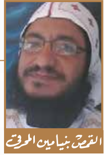
القصر بنيامين المرقسي